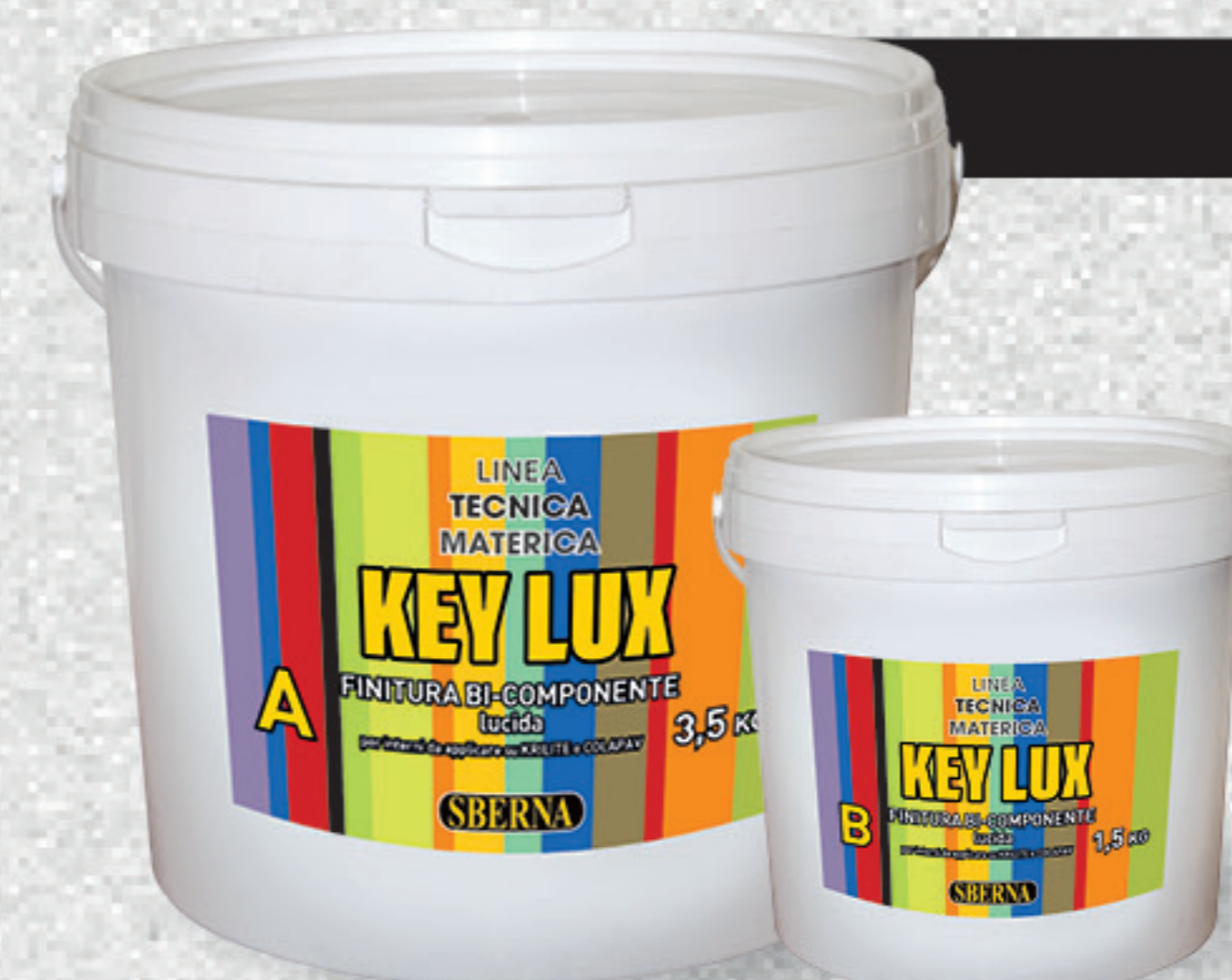
A - Kg 3,5