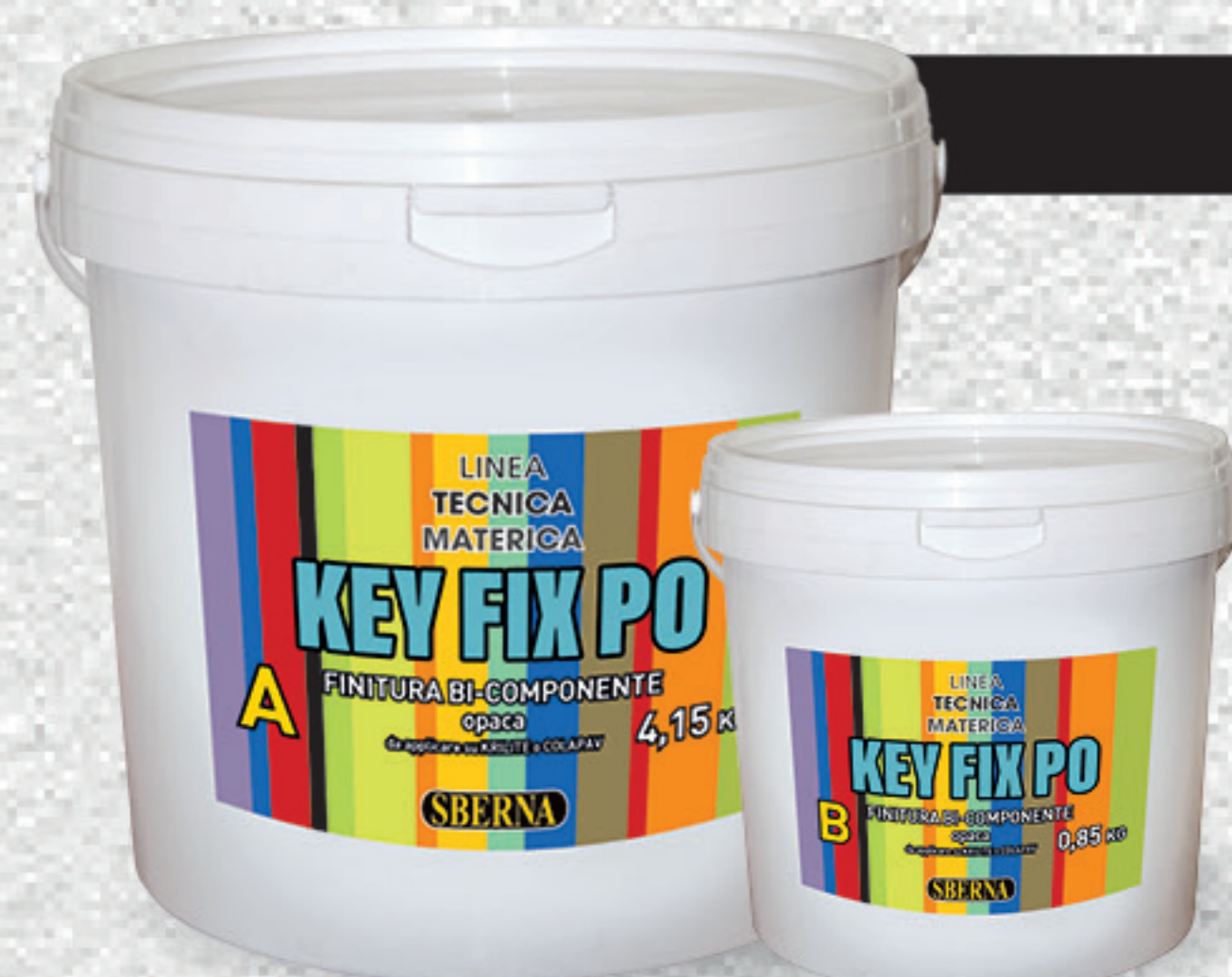
A - Kg 4,15