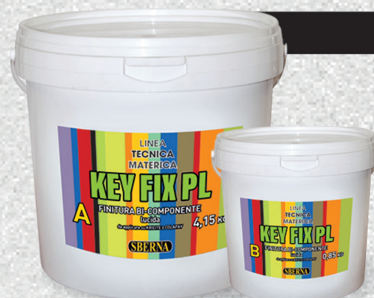
A - Kg 4,15